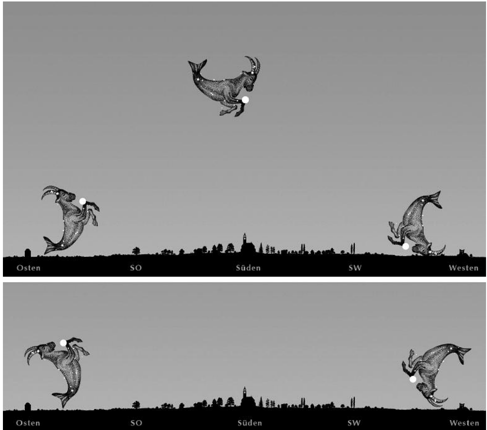
Bild 3ab: Die Nacht von 27. auf 28. Juli, der Himmelsbogen von Steinbock und Mars. 3a: Nairobi, 3b: Kapstadt