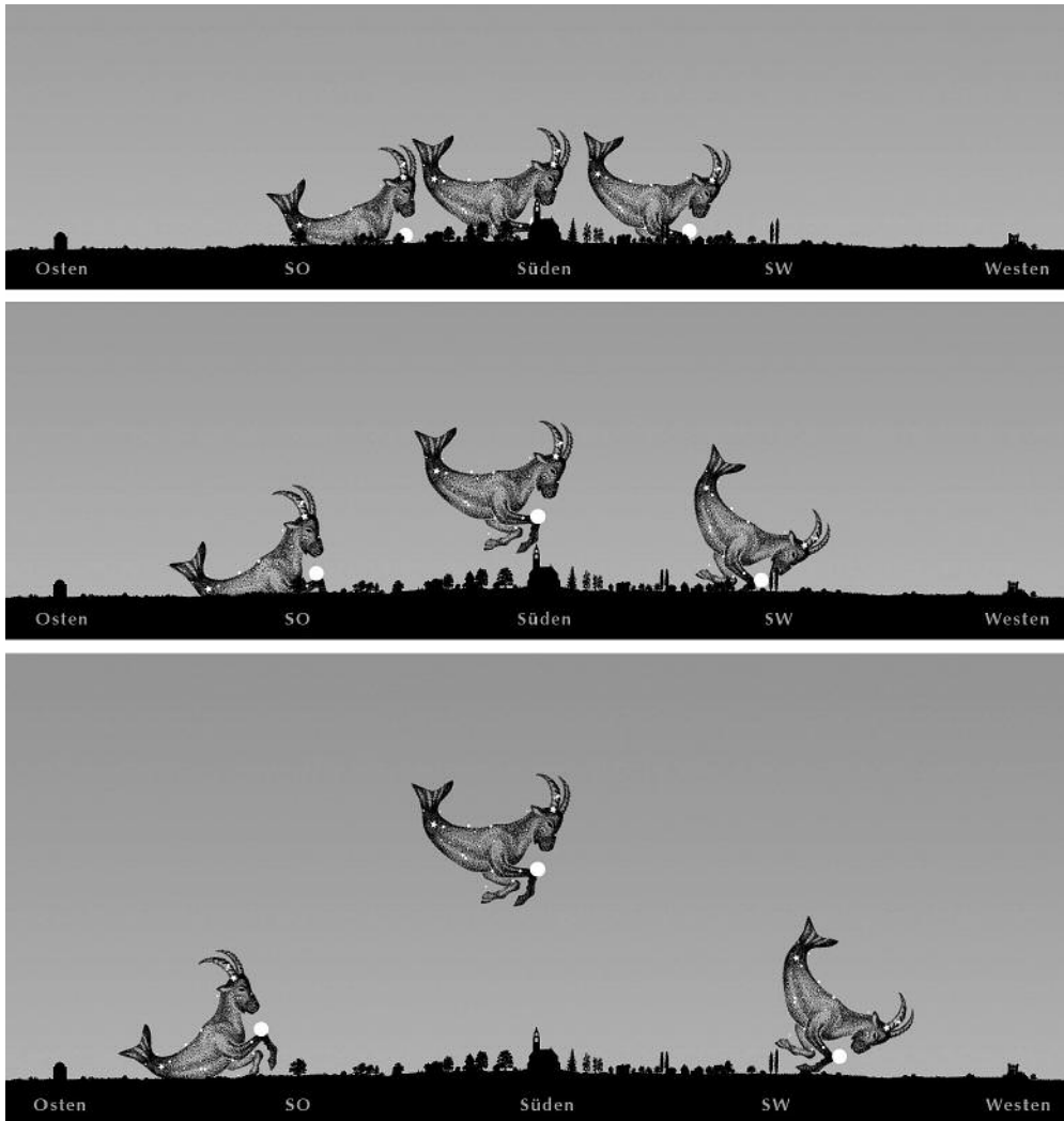
Bild 1abc: Die Nacht vom 27. auf 28. Juli, der Himmelsbogen von Steinbock und Mars. 1a: Oslo, 1b: Kassel, 1c: Athen